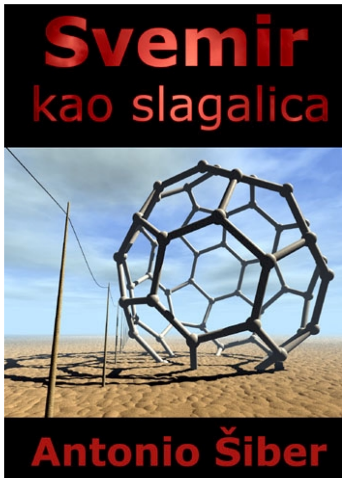
Slika 1: Naslovna stranica knjige «Svemir kao slagalica», sent to publication.

Drage kolege studenti, kad sam bio u vašim godinama (a to i nije bilo tako katastrofalno davno), mi nadobudni budući fizičari skloni ubojitim porocima, u sitne jutarnje sate često smo razgovarali o tome što nas to natjera da upišemo ovaj faks koji ničemu ne služi i koji ne daje nikakvu perspektivu. Pred kraj faksa, neki malo kasnije, a neki još i danas ne, shvatili smo da godine provedene u zgradi od žute cigle i nisu bile potpuno uzaludne. Naime, shvatili smo da smo naučili slobodno razmišljati. Radi se o tome da je prirodno-znanstvena spoznaja ujedno i spoznaja slobode – prave i velike ideje uvijek su bile nesputane i slobodne, ali uvijek i pristojne (u smislu prethodnog odlomka). Sjećam se u koji me je bed bacio Einsteinov izvod Planckove formule – mislim da sam tada shvatio zašto nikad neću biti poput Einsteina. Ali svejedno, naučio sam da racio oslobađa.