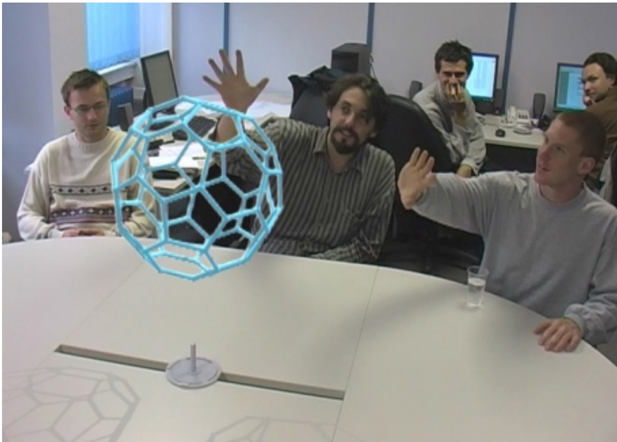
Slika 2: Jedan frame iz filma « Sfere unutar sfera »

Zato im moramo približiti naš pogled na svijet. Zato im moramo pokazati što je znanost u nadi da ćemo ih barem malo preodgojiti. Upravo tim stvarima se ja bavim u posljednje vrijeme. OK, pretjerao sam malo. Tim stvarima sam se počeo baviti iz nekih vrlo drugačijih razloga, ali s vremenom nalazimo niz opravdanja za svoje poroke, a ja sam vam prikazao ono koje najbolje zvuči. U svakom slučaju, u predavanju koje je rezervirao vaš štovani kolega chumez_crew govorit ću vam o tome zašto sam napisao popularno-znanstvenu knjigu « Svemir kao slagalica » i zašto i kako snimam film « Sfere unutar sfera ». Također ću odgovoriti i na u zadnje vrijeme prilično neukusne objede Stevena Spielberga da se on toga prvi sjetio, jer nije važno tko se nečega prvi sjeti, nego tko realizira tu ideju. Prikazat ću vam i neke ekskluzivne kadrove iz filma « Sfere » koji po prvi put izlaze izvan uskog kruga zagriženih fanova. Nadam se da ćemo imati prilike i diskutirati o kvantnoj fizici, mogućnostima za svemirski turizam, kao i o uporabi specijalnih filmskih efekata za potrebe preodgoja. Nakon predavanja, bit ću slobodan pozvati sve zainteresirane da mi se u mojim pothvatima i pridruže, ali samo ukoliko zbilja nemaju nikakvog pametnijeg posla.